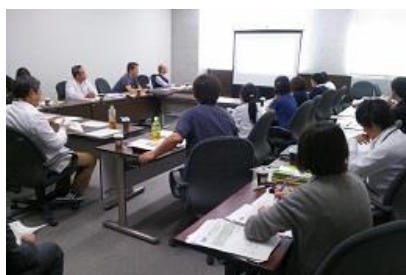
11/6 岐阜大学病院シミュレーション