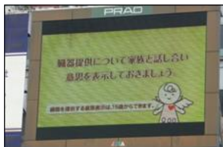
ニュースビジョン