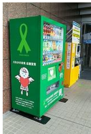
グリーンリボン仕様自動販売機