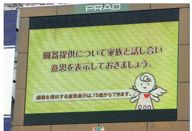
ニュースビジョン