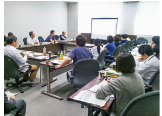
11/6岐阜大学病院シミュレーション