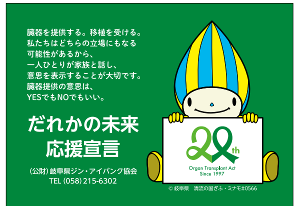
ポケットティッシュ