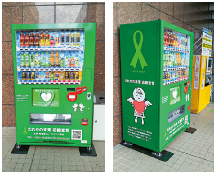
グリーンリボン仕様自動販売機